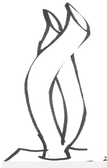
Obrázok 3 - 1 Návrh objektu O-KONFLIKT (2002)